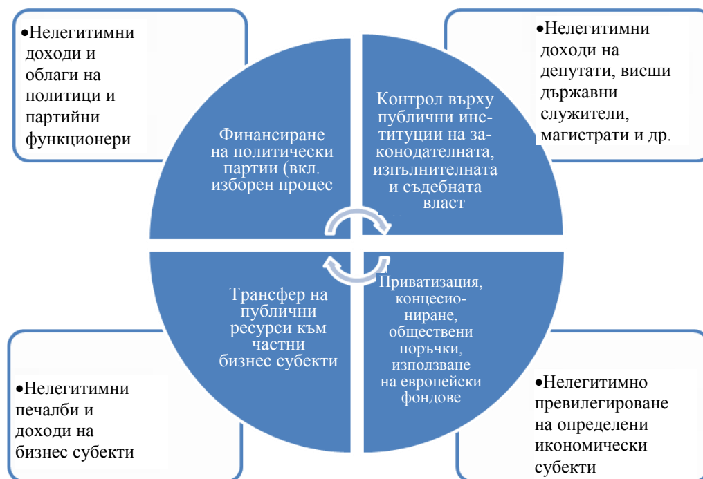
Фигура 1. Публично-частен корупционен политико-икономически модел

Този корупционен политико-икономически модел е тясно свързан и с развитието на "сивата" и "черната" икономика. Идентифицират се специфични форми на влияние и срастване на криминални структури с публични институции, създаващи условия за незаконни публично-частни корупционни сделки. Незаконните ("черни") и нерегистрираните ("сиви") икономически дейности са източник на значителни доходи за организираната престъпност и представителите на "сенчестия" бизнес. В този смисъл може да се говори за съществуването на един значим стопански сектор, който условно може да бъде наречен "скрита икономика". Нейното съществуване е пряко свързано и на практика невъзможно без покровителство на високопоставени служители в публичните институции на законодателната, изпълнителната и съдебната власт и развитието на мащабни публично-частни корупционни квази пазари. Трансферът на значителни средства от "черната" и "сивата" икономика към политици, държавни служители и магистрати се превръща в необходимо условие за възпроизводството на незаконните и полулегални операции на тези групировки. В много случаи те правят опити да проникнат непосредствено в структурите на законодателната, изпълнителната и съдебната власт и да контролират вземаните решения в собствен интерес.